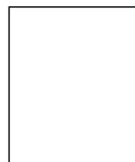
Huella Digital (índice derecho)

(*) Establece prohibiciones e incompatibilidades de funcionarios y servidores públicos, así como de las personas que presenten servicios bajo cualquier modalidad contractual.